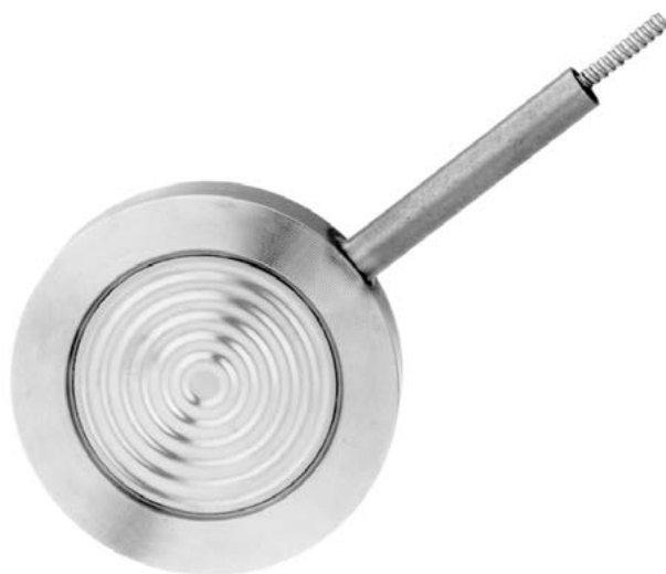
Separator membranowy, konstrukcja płytkowa międzykołnierzowa z kapilarą model 990.28