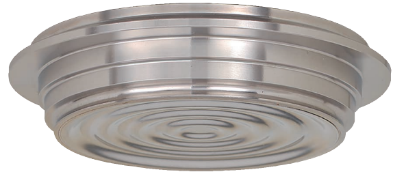
Selo diafragma com conexão asséptica, modelo 990.24