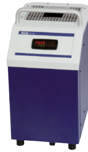
Temperatur-Blockkalibrator Typ CTD9100-165

© 2014 WIKA Alexander Wiegand SE & Co. KG, alle Rechte vorbehalten. Die in diesem Dokument beschriebenen Geräte entsprechen in ihren technischen Daten dem derzeitigen Stand der Technik. Änderungen und den Austausch von Werkstoffen behalten wir uns vor.