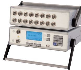
Präzisionsthermometer Typ CTR5000 mit Multiplexer Typ CTS5000

Um eine bestmögliche Leistung der Präzisionsthermometer zu erreichen, müssen die Koeffizienten/Charakterisierungen des Temperaturfühlers berechnet und im verwendeten Messgerätekanal (oder bei der Verwendung von SMART-Fühlern im Steckverbinder des Fühlers) gespeichert werden.