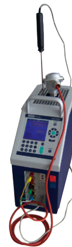
CTD9300 in der Anwendung mit einem externen Referenzthermometer

Wenn Prüflinge nicht bis auf den Hülsenboden eingeführt werden können, sollte ein externes Referenzthermometer verwendet werden. Dann können Referenz und Prüfling auf