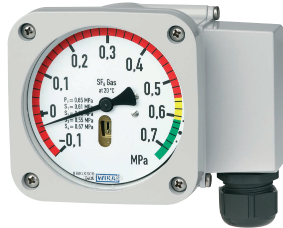
Manodensostato con camera di riferimento, modello GDM-RC-100

Come nel caso del manodensostato GDM-100, anche per il modello GDM-RC-100 WIKA si affida al collaudato principio